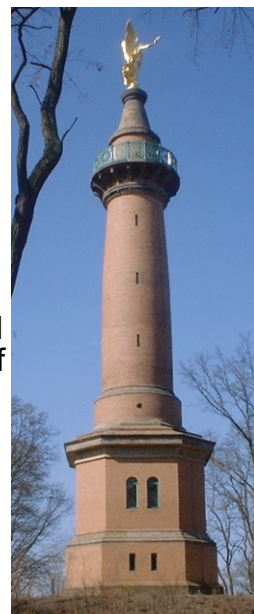
DorisAntony - Eigenes Werk